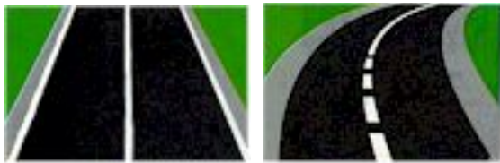
Doorlopende witte lijn