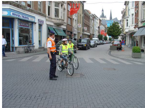
Links kruisen op bevel van agent